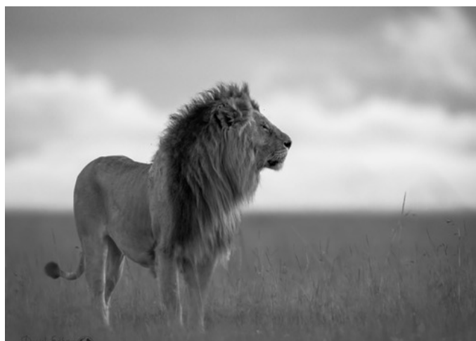
Daniel Eriksson Naturfotograf Tjudö

Det skulle vara kul om du kunde komma på vernissage onsdagen den 6. september klockan 18.00 – 20.00 så kan jag berätta lite mer om foton och resan.