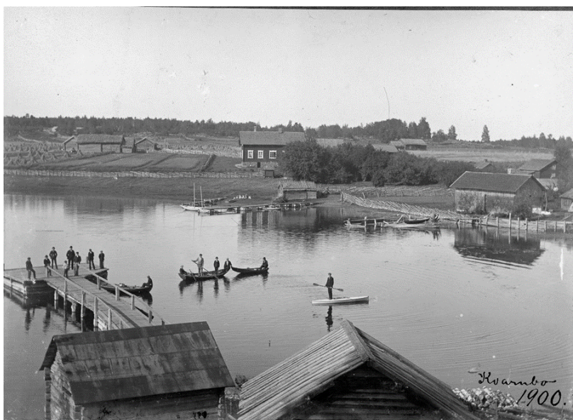
Foto: En kväll i Kvarnboviken år 1900